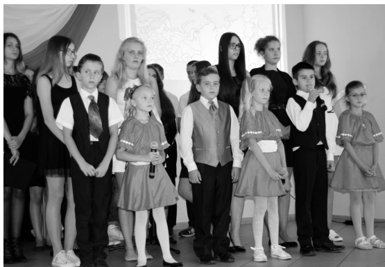
Młodzież przedstawiająca losy zesłańców Sybiru

portowano w kwietniu, a około 80 tys. w czerwcu. Wywózki prowadzono także w 1941 r. Obecnie nadal nie wiadomo, ilu dokładnie Polaków łącznie zostało zesłanych na Syberię. Historycy szacują, że może to być nawet około miliona osób. Polacy kierowani byli do przymusowej pracy w kołchozach i zakładach pracy, część trafiała do łagrów. Celem okupanta była sowietyzacja polskich ziem, a wywóz Polaków w głąb ZSRR był jednym z elementów prowadzonej polityki.