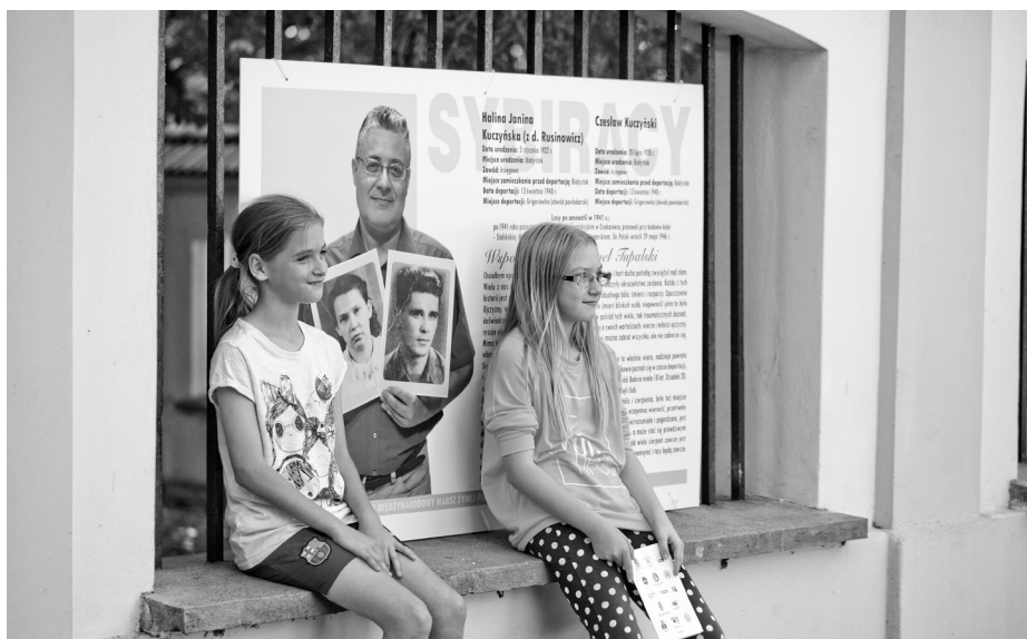
Wystawa przygotowana przez Wspólnotę Wnuków Sybiraków „Ich przeżycia – nasza pamięć”

Wystawa ukazuje sybiraków widzianych oczami ich wnuczek i wnuków, którzy wspominają zesłańcze losy swoich bliskich, ale przede wszystkim wspominają ich jako ludzi, którzy przekazywali im wartości, darzyli miłością, kształtowali charaktery, wpływali na ich widzenie świata, często byli podporą w trudnych chwilach. Pomimo ciężkich i często tragicznych