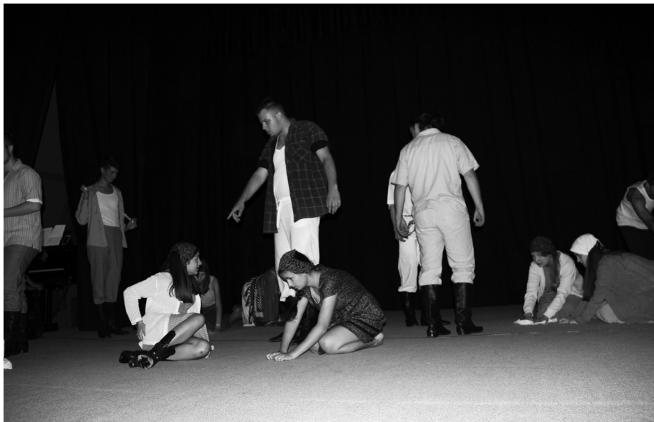
Grupa Artystyczna „SAFO” w premierowym programie „Matkom Sybiru”