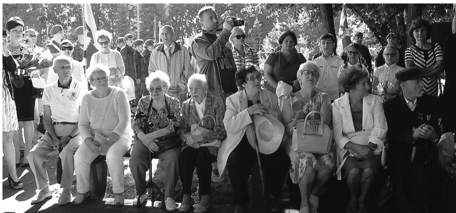
Sybiracy uczestniczący w uroczystości