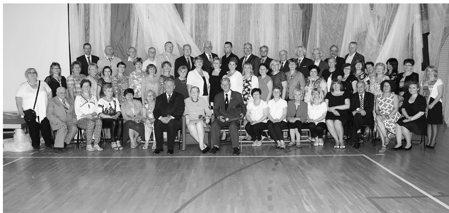
Zdjęcie pamiątkowe uczestników VI Zjazdu