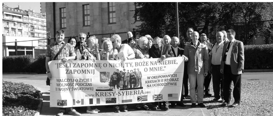
Członkowie Fundacji Kresy-Syberia i uczestnicy konferencji „Pamięć Pokoleń 2016”

Na placu Muzeum Katyńskiego, w pierwszą rocznicę jego otwarcia, zgromadziły się Rodziny Katyńskie i Policyjne, członkowie Związku Sy-