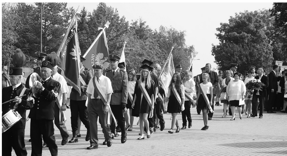
VI Marsz Sybiracki Ziemi Zgorzeleckiej

Nawiązując do słów Marszu Związku Sybiraków, 16 września 2016 r. w piątek punktualnie o godz. 11 spod Gimnazjum im. Sybiraków w Jerzmankach wyruszył już po raz szósty Marsz Sybiracki Ziemi Zgorzeleckiej. Cała