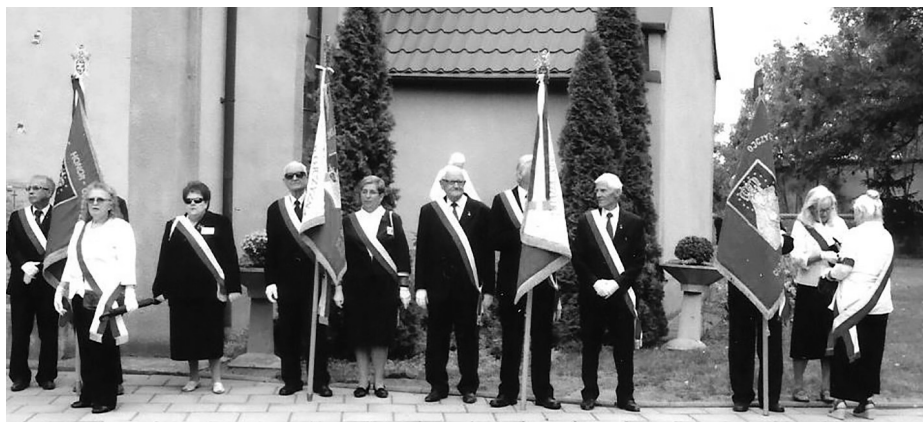
Poczty sztandarowe Oddziału ZS w Legnicy i legnickich Kół