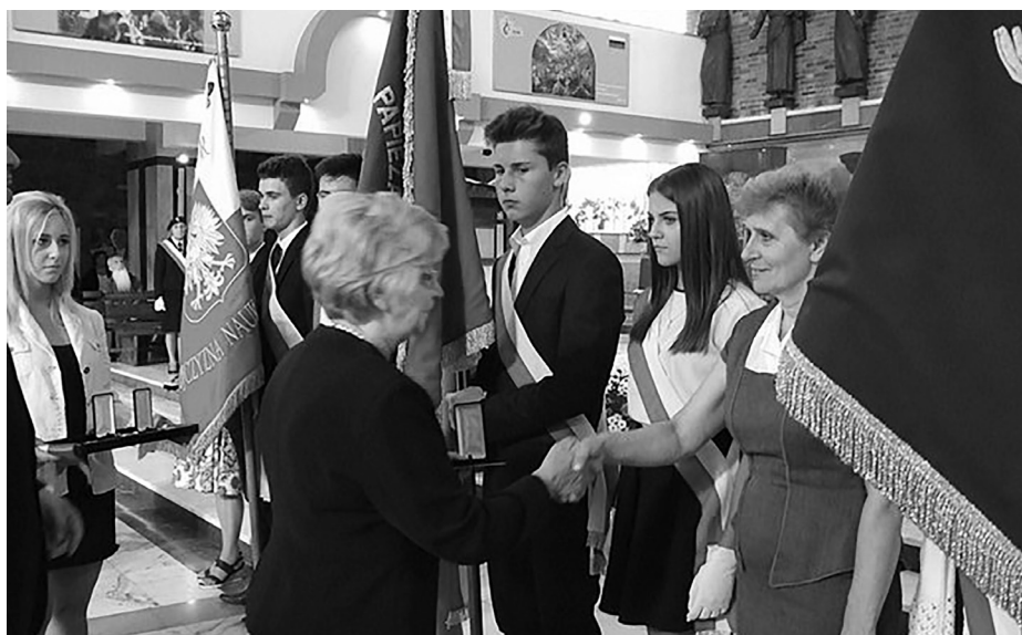
Odznaczenie medalem Pro Patria szkół współpracujących z Oddziałem ZS w Łomży

Sztandary jako odwieczne symbole polskich tradycji, patriotyzmu i jedności budzą dreszcz emocji podczas ich wprowadzenia i pokłonów przed ołtarzem. Sztandar to także znak symbolizujący wojsko, miasto, szkołę, stowarzyszenie. W strofach wiersza Władysława Bełzy o sztandarze czytamy: „Nieśmy go górą! Niech on nam wieści o dawnym duchu ofiary. Nieśmy go wiernie we łzach i boleści, lecz go ratujmy z krwi i bezceści jako Rzymianin swe lary”. W świątyni rozległ się Hymn Sybiraków, którego z powagą słuchali uczestnicy, w oczach sybiraków pojawiły się łzy wzruszenia.