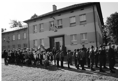
Spółeczność szkolna i zaproszeni goście w czasie przemarszu do kościoła