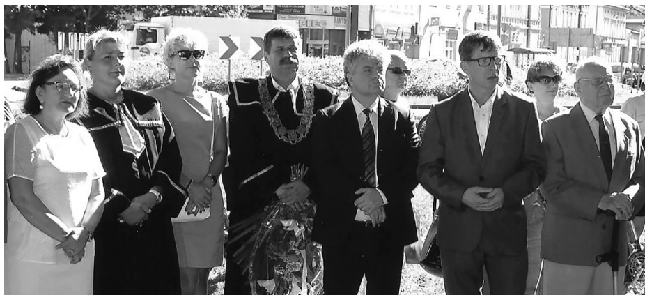
Władze miasta i powiatu podczas uroczystości

sięciolecia panowała zmowa milczenia na temat losu, jaki spotkał Polaków na Wschodzie. Jednak pamięć o tych ludzkich tragediach trwała w naszych domach, pielęgnowana zwłaszcza przez tych, którym dane było przeżyć i wrócić z »niehumanitarnej ziemi«. Czas nieubłaganie płynie, coraz mniej jest z nami uczestników i świadków tych niehumanitarnych zbrodni. Zarówno tym, którzy przeżyli i powrócili do ojczyzny, jak i tym, którzy zmarli na obcej i nieprzyjaznej ziemi, winni jesteśmy pamięć i szacunek”.