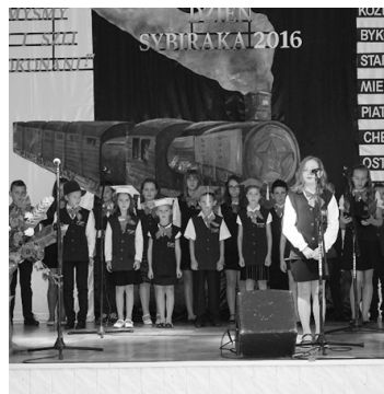
Montaż słowno-muzyczny w wykonaniu uczniów szkoły

W krótkim przemówieniu dyrektor szkoły przybliżyła idee Dnia Patrona, zaznaczając potrzebę pamięci o tragicznym losie zesłańców.