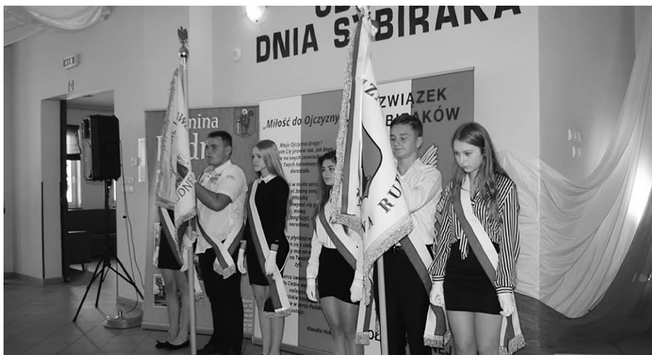
Poczty sztandarowe złożone z uczniów szkół w Rudnej

„Nowiny Gminne” nr 10 (186) z października 2016 r.