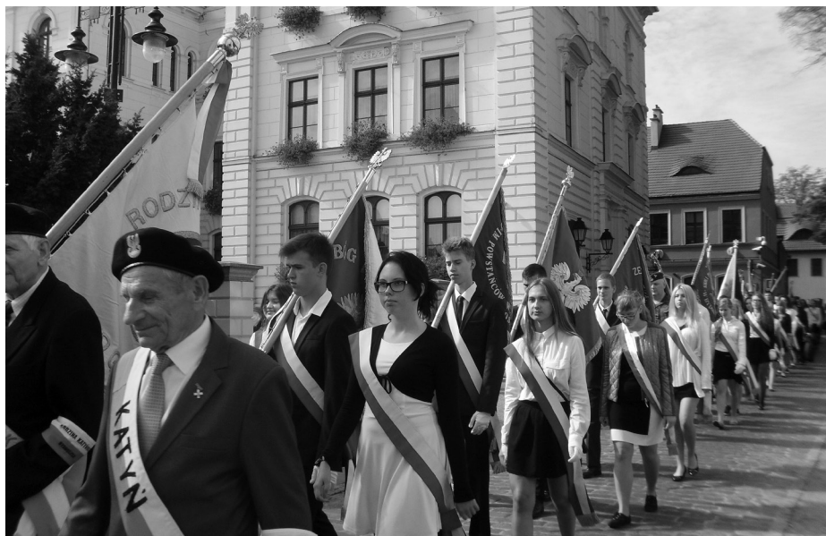
Przemarsz z katedry na miejsce zgromadzenia patriotycznego na Starym Rynku