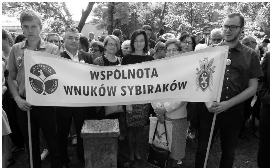
Wnukowie i wnuczki sybiraków w XVI Międzynarodowym Marszu Żywej Pamięci Polskiego Sybiru w Białymstoku

Barbara Bielawiec, zdjęcia archiwum WWS, Szczepan Skibicki