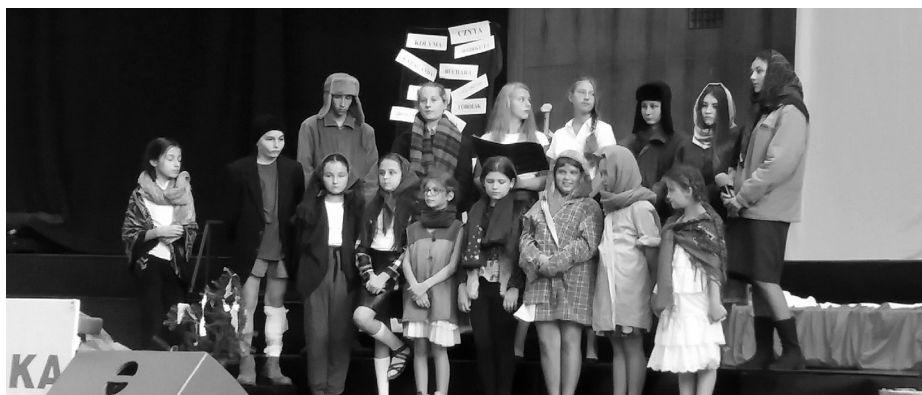
Występ uczniów z Zespołu Szkół w Wiązowie