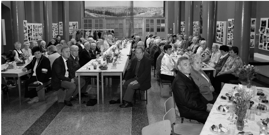
Spotkanie członków przemyskiego Oddziału ZS