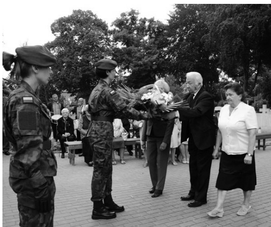
Kwiaty składają przedstawiciele Koła ZS w Głogowie