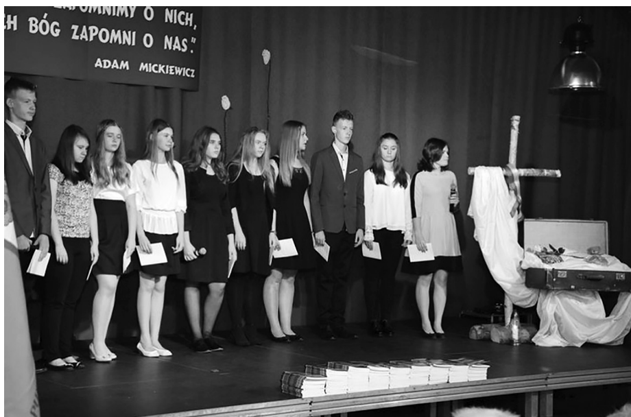
Uroczystość uświetnił występ uczniów