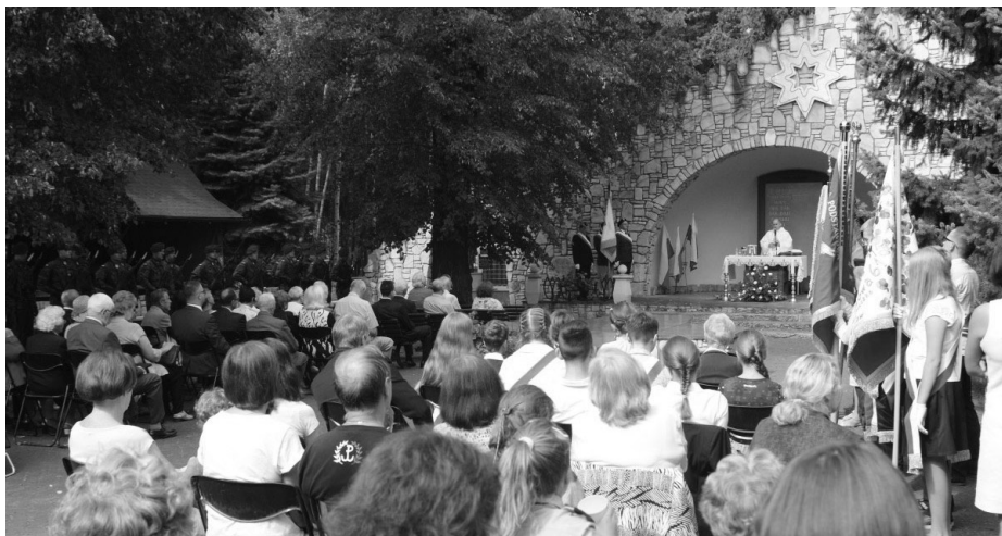
Msza w intencji ojczyzny