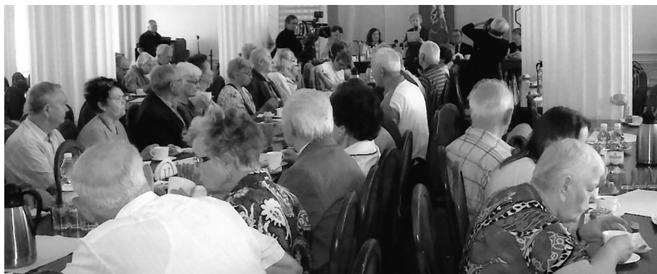
Uroczyste spotkanie z okazji Dnia Sybiraka w Rzeszowie