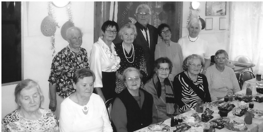
Uczestnicy spotkania 30 września 2016 r.

wierki, głodu, chorób, pracy ponad siły i wrócić do ojczyzny. To wywózka Polaków bydłecymi wagonami przy 30-stopniowym mrozie na bezkresne tereny Syberii, Kazachstanu i wielu innych miejsc Związku Radzieckiego. 17 września to także hołd składany wszystkim tym, którzy pozostali na tej „niehumanitarnej ziemi” na zawsze.