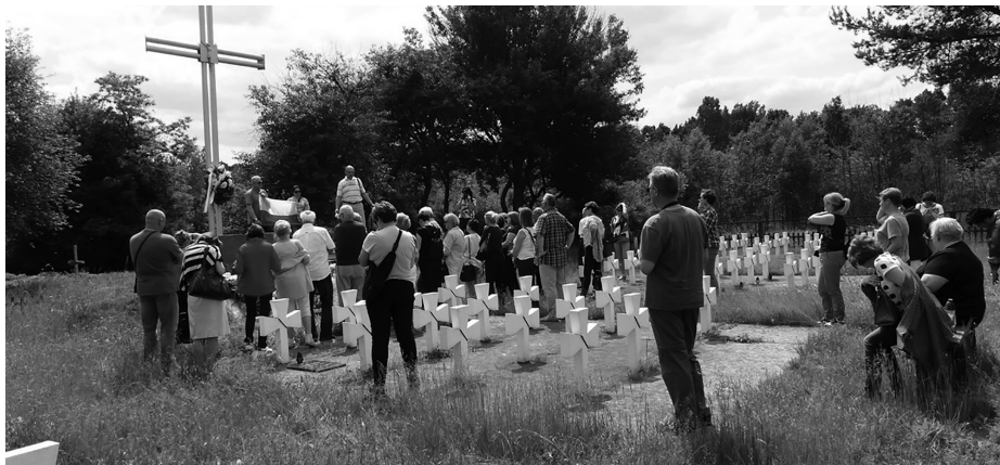
Rymacze – cmentarz żołnierzy 27. Wołyńskiej Dywizji Piechoty Armii Krajowej

Kolejnym punktem wizyty było spotkanie przed pomnikiem upamiętniającym Ofiary Sybiru, gdzie uczestnicy Zjazdu wraz z młodzieżą szkolną oddali hołd ofiarom Golgoty Wschodu. Złożone kwiaty i zapalone symboliczne znicze stały się dowodem naszej pamięci i wyrazem szacunku dla rodziny sybirackiej.