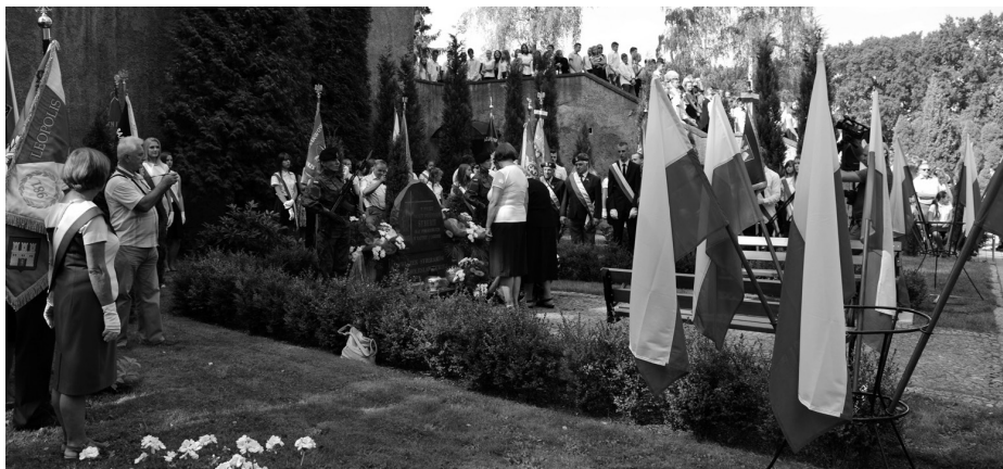
Złożenie kwiatów pod pomnikiem „W hołdzie Polskim Męczennikom Syberii oraz Pomordowanym w Katyniu i Łagrach”